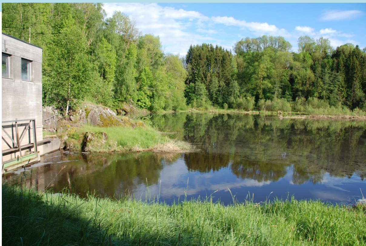
Lekumevja, Eidsberg.